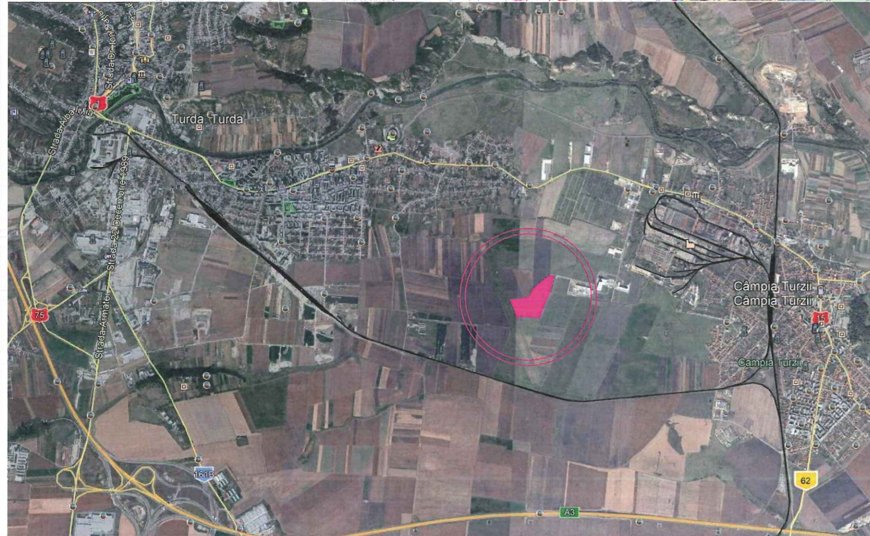
Plan de încadrare în PUG